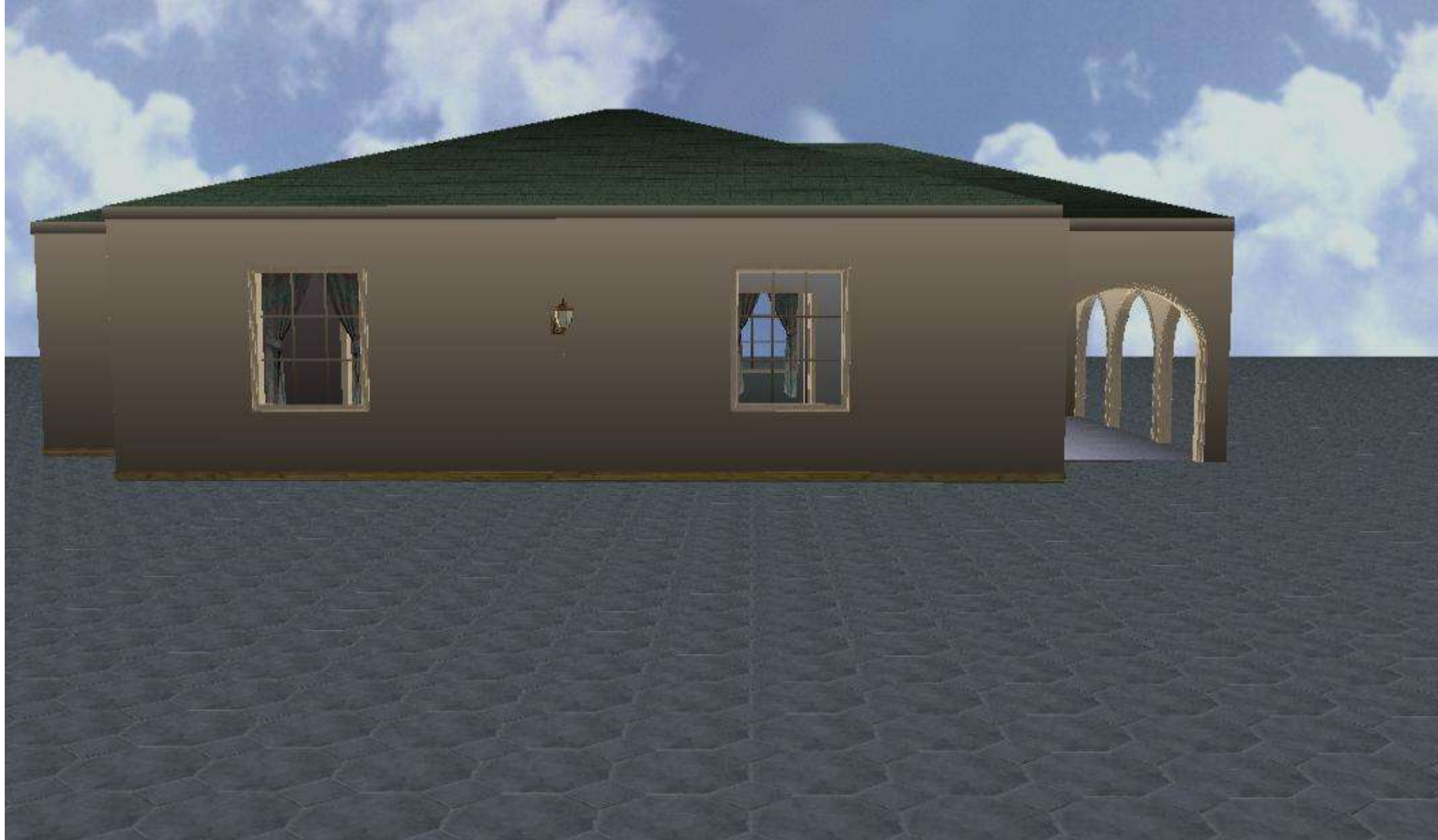
Vue de la façade droite