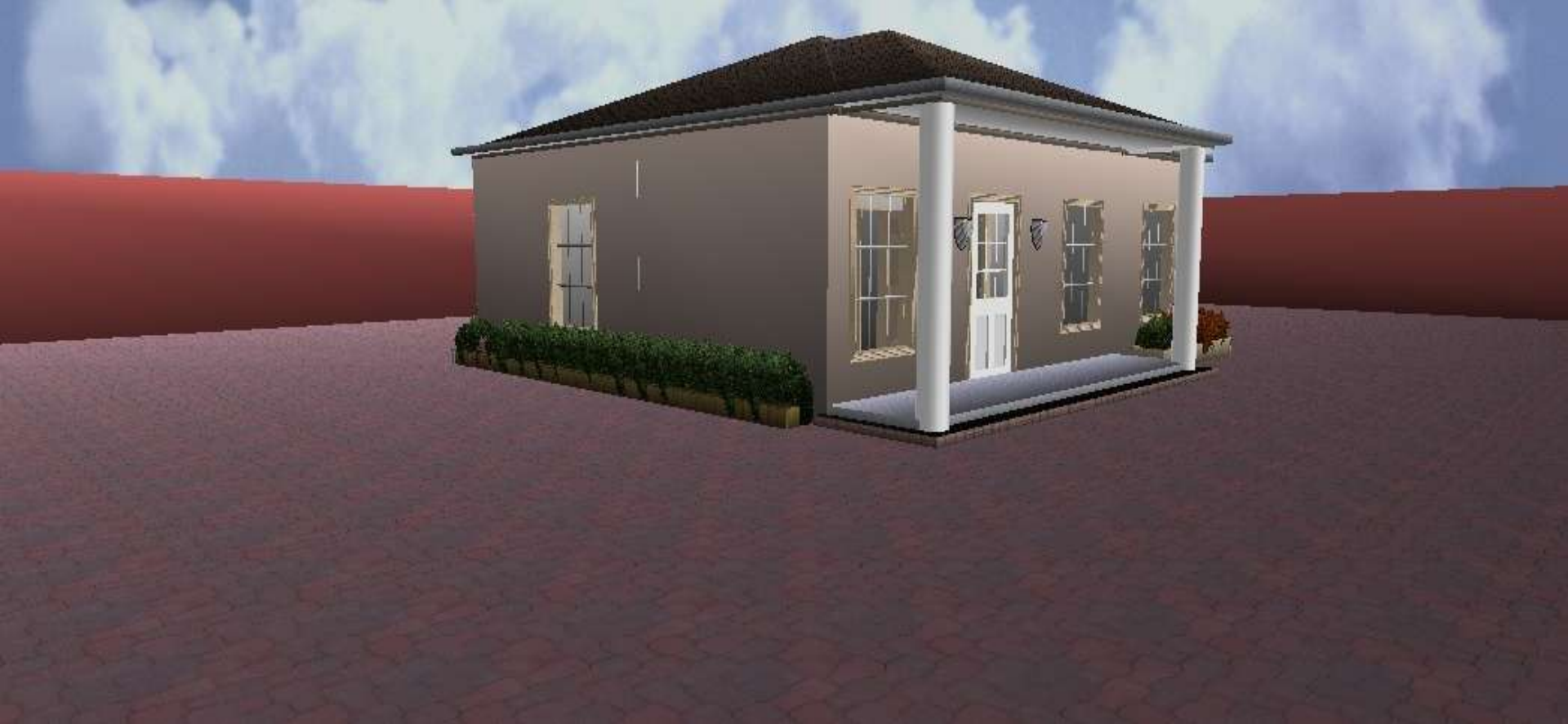
Perspective façade principale